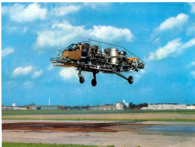
1967 - Luchtvaartlaboratorium - Testen van SG1262 Jet-Lift simulator