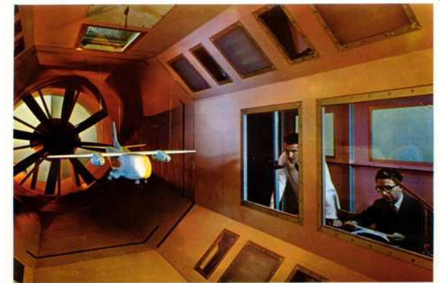
Fiat Aircraft Section - Subsonic wind tunnel.