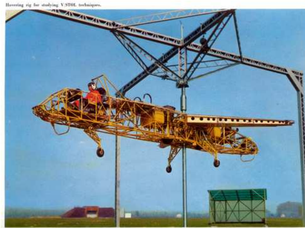
Fiat was zeer actief in de luchtvaart. Hier wordt een VSTOL-platform getest (Very Short Take-Off and Landing) (1967)