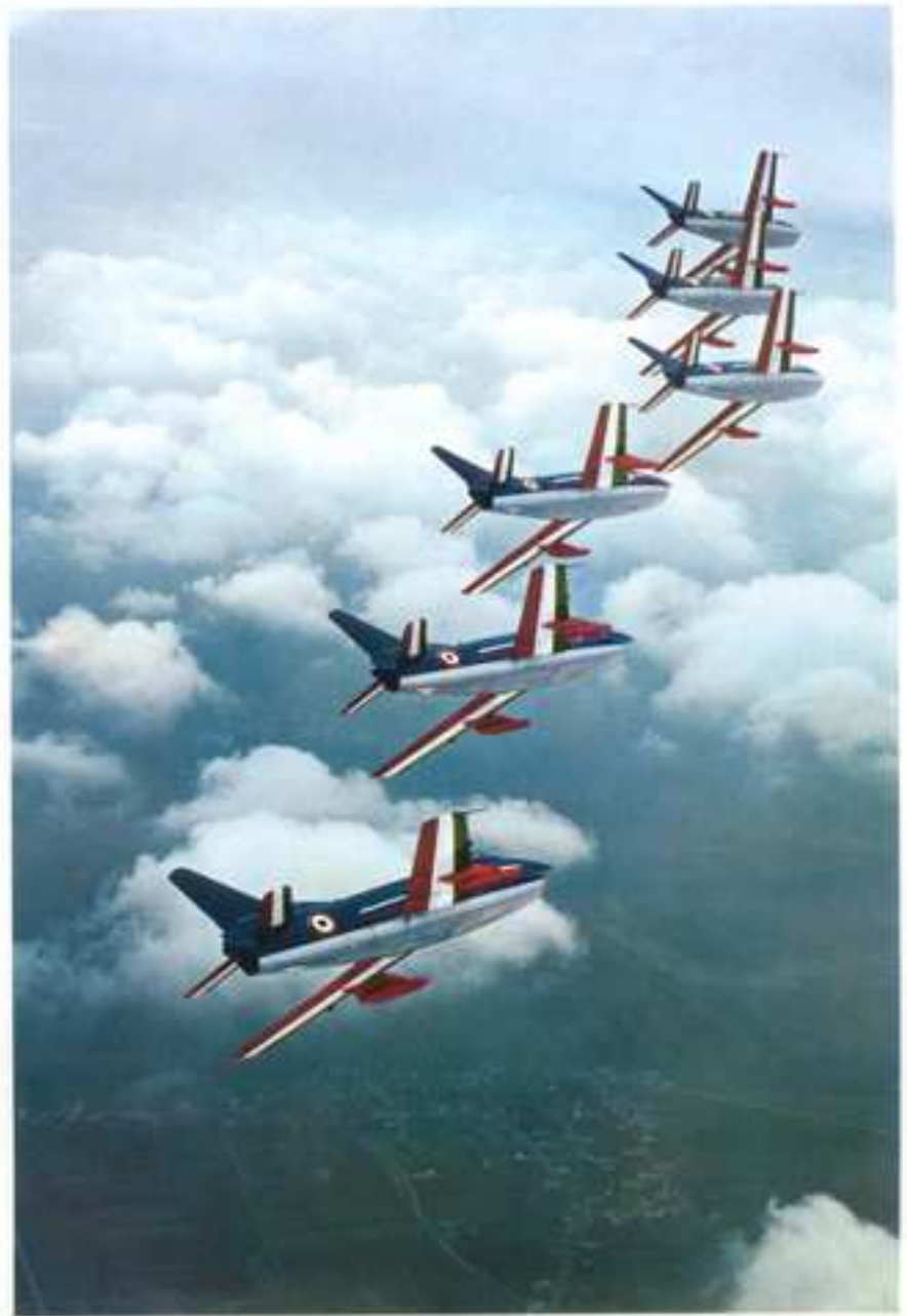
Finnish jet aerobatics team