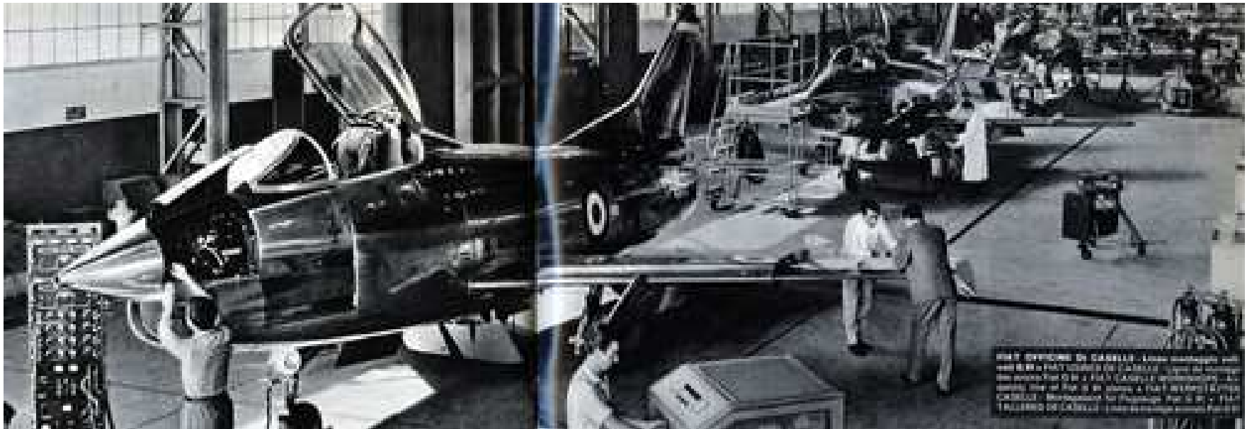
FIAT SEZIONE DI CARRELLI - Lavoro montaggio e collaudi dei carri per il trasporto delle parti e dei materiali. In primo piano il carro per il trasporto delle parti e dei materiali. In basso a sinistra il carro per il trasporto dei materiali. In basso a destra il carro per il trasporto delle parti e dei materiali.