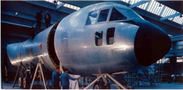
Productie van een prototype van de G222 (1967) ⇔