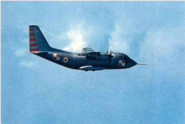
Proefvlucht G222 (Juli 1970)

De G222 is gebouwd door Aeritalia, waarin Fiat Aviazione opging. Meer informatie ook van dit toestel op Wikipedia.